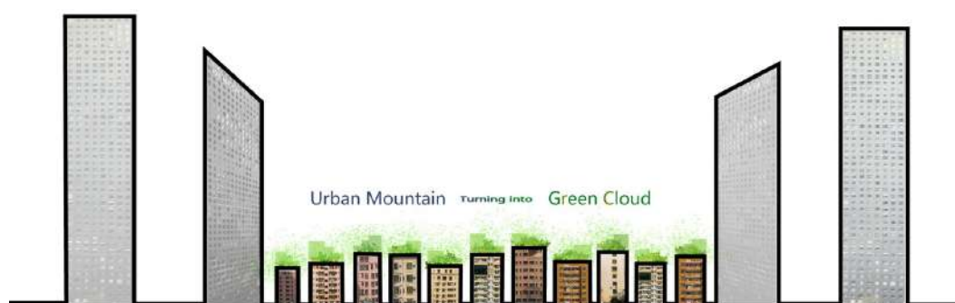
Gambar 1. Konsep Urban Mountain dengan Penerapan Green Cloud

Ruang publik green cloud di letakkan di atas rusun-rusun kumuh yang ada di daerah Gangxia Village, Shenzhen, China. Urban mountain merupakan konsep dari penempatan ruang green cloud ini. Urban mountain adalah konsep yang ditujukan untuk membuat penghijauan di antara gedung-gedung tinggi yang berjumlah sangat banyak di Gangxia Village. Gangxia Village sendiri merupakan kawasan urban yang terdiri dari banyak permukiman vertikal. Permukiman vertikal banyak digunakan pada daerah ini karena padatnya jumlah penduduk. Dengan padatnya bangunan vertikal di daerah ini, mengakibatkan minimnya ruang hijau terbuka pada Gangxia Village. Konsep dari penempatan ruang publik di atas rusun merupakan salah satu solusi land use untuk mengatasi kurangnya ruang terbuka tersebut. Penghijauan dilakukan di atas gedung-gedung rusun sebagai alternatif akan ruang hijau terbuka.