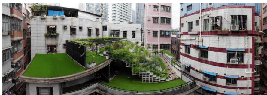
Gambar 4. Green Cloud dan Lingkungan Sekitar

Green Cloud juga didasarkan oleh kebutuhan lingkungan, dimana banyaknya bangunan yang ada serta telah meningginya permukaan laut membuat sebuah ruang publik hijau sulit untuk dibangun karena terbatasnya lahan dan potensi untuk tenggelam apabila terjadi banjir. Padahal, bangunan yang memiliki populasi yang tinggi tentu butuh ruang terbuka untuk berkumpul. Sehingga dengan latar belakang tersebut, ada urgensi untuk membangun Green Cloud yang menyesuaikan kebutuhan lingkungan.