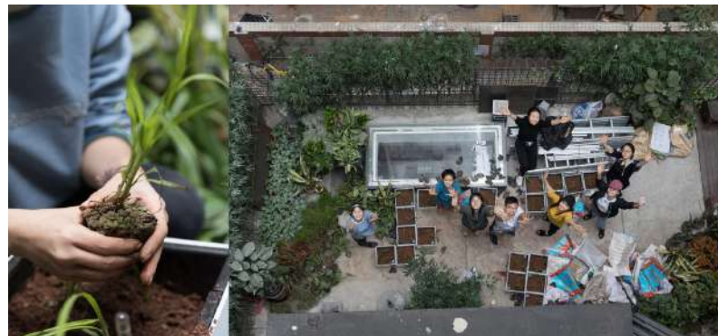
Gambar 7. Aktivitas Bertanam

Karena sifatnya yang berfungsi sebagai public space, serta tidak adanya area untuk berkumpul, maka tentu area ini sering dikunjungi oleh penghuni yang ada di daerah tersebut. Dengan sifat taman terbuka ini, penghuni harus menyiram media-media tanam sendiri, sehingga mewajibkan penghuni untuk berkunjung dan menghidupkan area ini dengan aktivitas-aktivitas yang ada didalamnya.