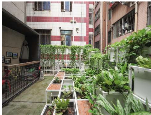
Gambar 2. Material Kayu dan Baja Daur Ulang

Green Cloud China mengadopsi pendekatan penggunaan material berkelanjutan dalam konstruksi bangunan dan infrastruktur di area tersebut. Mereka memprioritaskan penggunaan material daur ulang seperti kayu daur ulang atau baja daur ulang yang memiliki siklus hidup yang lebih panjang daripada material baru, sehingga mengurangi kebutuhan akan material baru yang berpotensi menghasilkan limbah.