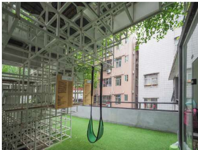
Gambar 3. Struktur Modul Playground

Gangxia Village merupakan kawasan urban yang terdiri dari banyak permukiman vertikal. Permukiman vertikal pada daerah ini terdiri dari banyak rumah susun kumuh yang mempunyai lahan terbatas untuk aktivitas sosial. Kurangnya lahan terbuka dan ruang publik mengakibatkan penghuni bangunan kurang berinteraksi satu sama lain. Hadirnya green cloud memberikan angin baru bagi penduduk penduduk rumah susun di daerah Gangxia Village. Ruang publik terbuka sebagai wadah aktivitas sosial dihadirkan melalui penggunaan struktur modul untuk mengatasi kurangnya lahan terbuka di lingkungan sekitar.